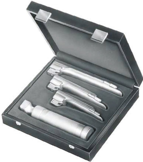
Foregger V 09-111-01 V 09-113-00