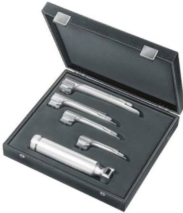
Miller/Miller-Baby V 09-101-00 V 09-104-04