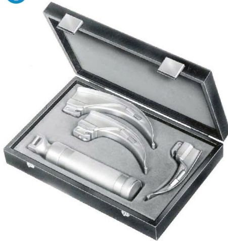
McIntosh V 09-108-00 V 09-109-00